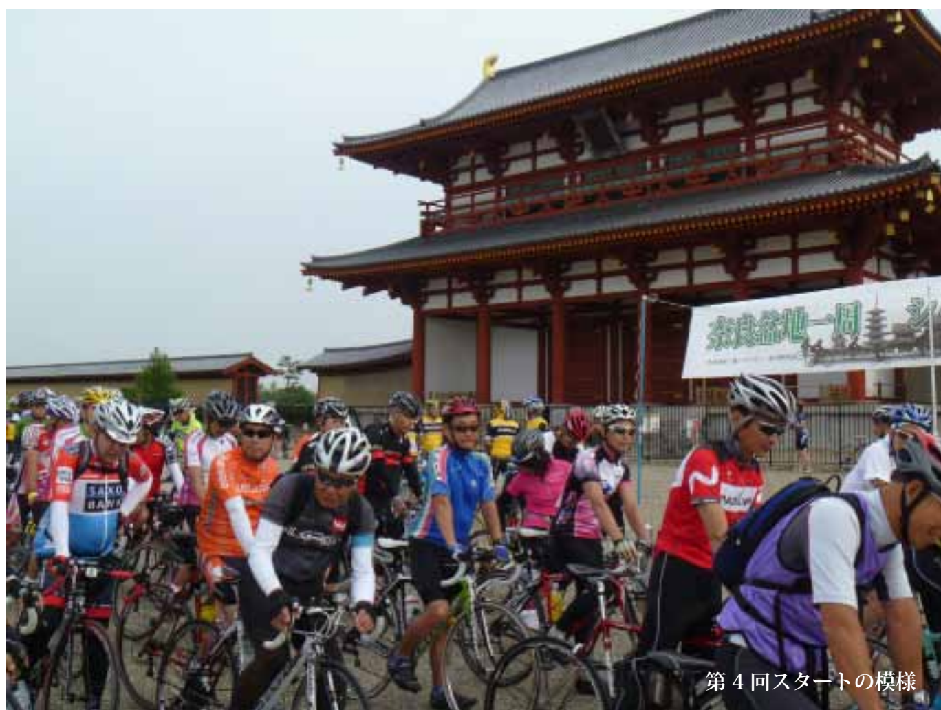
第4回スタートの様様